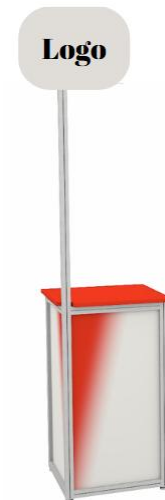
Visualisierung Änderungen vorbehalten