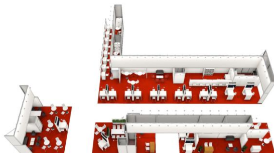
Ansicht des Swiss Pavilion 2026

Die Standgrösse wird gemäss Anmeldungen angepasst. Standbau-Partner seit vier Jahren: Capital Service der Messe Berlin.